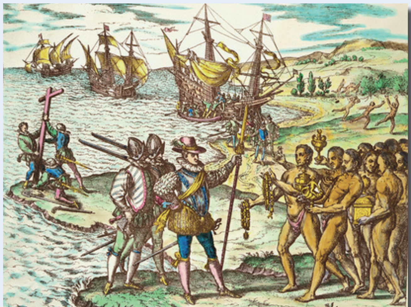
Gravure de T. de Bry (1594) extrait d'un manuel d'histoire et illustrant la découverte de l'Amérique.

UNICAEN université de Caen Basse-Normandie