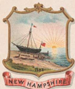
1623 NEW HAMPSHIRE 1785