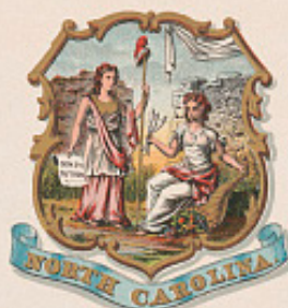
1650 NORTH CAROLINA 1789