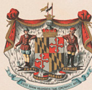
1634 MARYLAND 1788